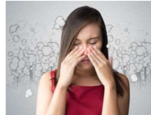
Qualité et conditions de vie insuffisantes