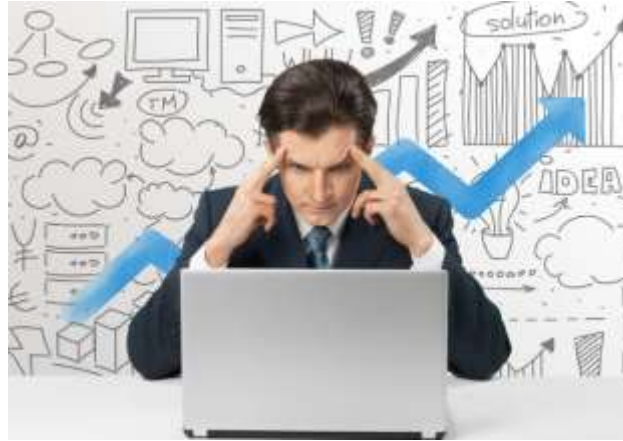
Manque d'opportunités entrepreneuriales