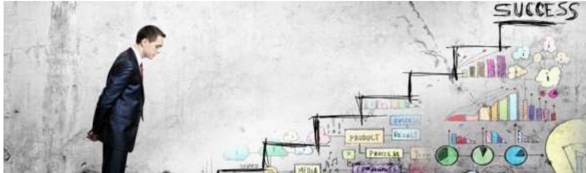
Désir d'entreprendre et d'investir en Tunisie