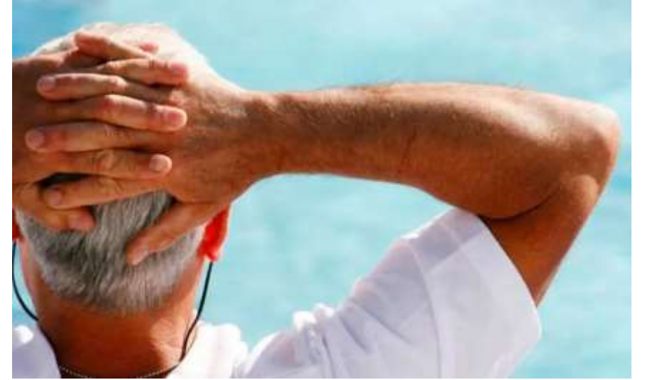
Projet de retraite au pays