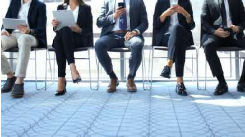
Rigidité du Marché de Travail