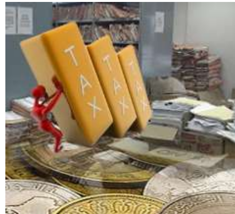
Système fiscal et réglementaire peu favorable